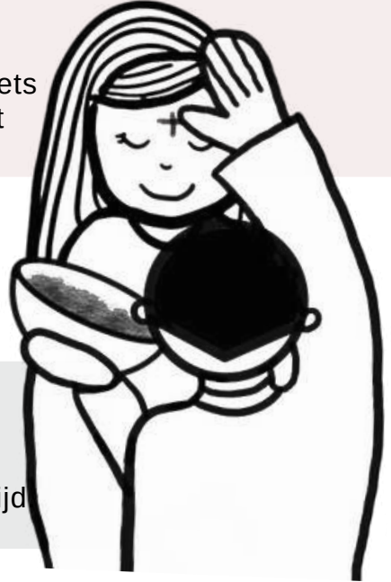
Tekst: Hagenpreken.nl/wdm | Illustraties: Crafty Little Blessings

Mogen anderen dan niet zien dat je iets goeds doet? Natuurlijk wel. Als je het maar niet expres dáárom doet.