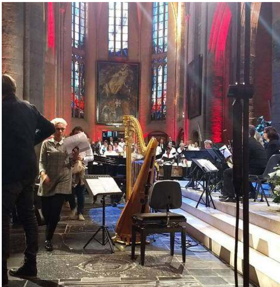
'Nederland Zingt' in de Kathedraal

12 o jaargang nr. 5 7 okt. - 16 dec. 2018