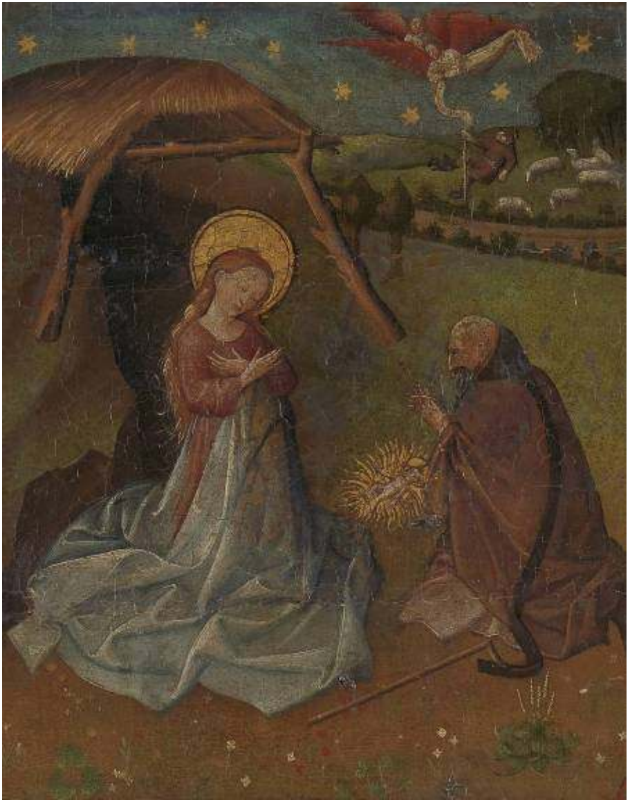
Tafereel van de Geboorte des Heren van de Roermondse Passietafel (1435). 'Zo klein maakt God zich voor ons'