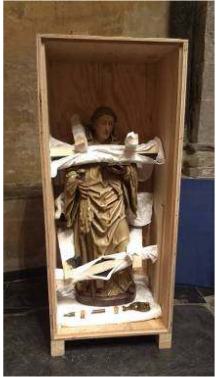
Sint Bernardus reist af naar Maastricht